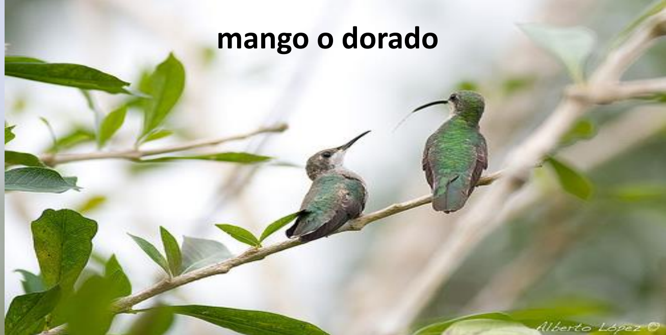
mango o dorado