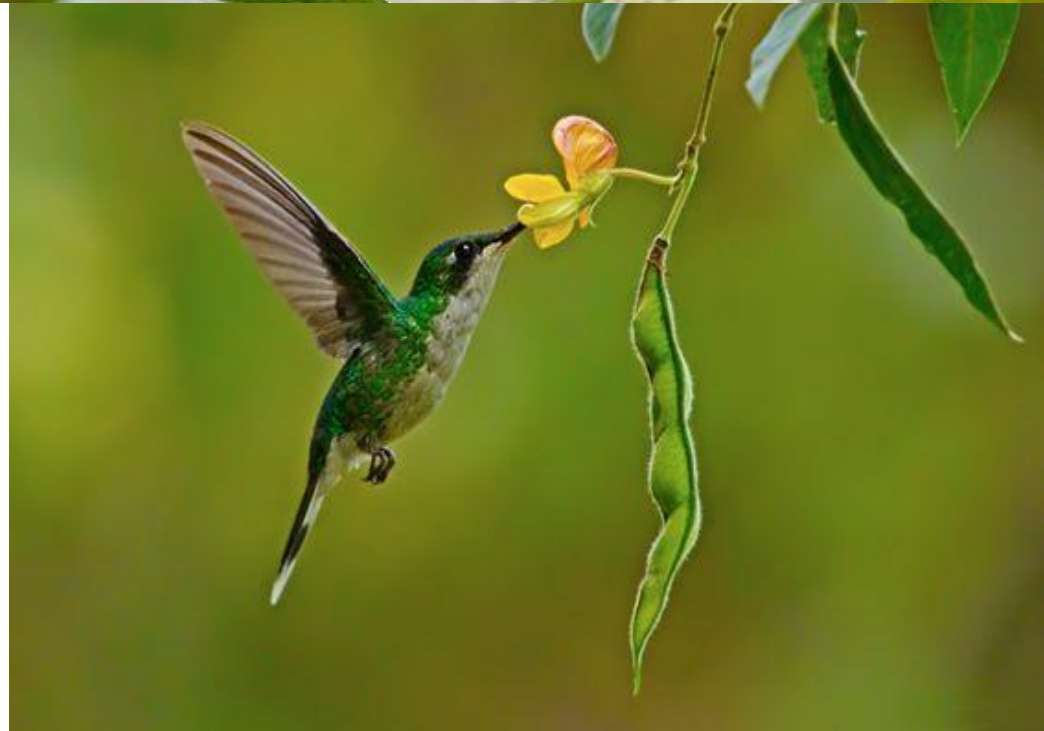
zumbador, colibrí o guaní